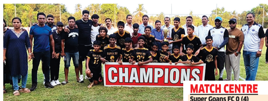
Super Goans pose with the trophy alongside supporters and other dignitaries.