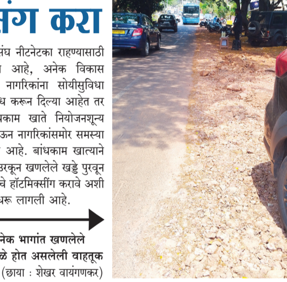
पर्वरीत मतदारसंघ नीटनेटका राहण्यासाठी प्रयत्न करीत आहे, अनेक विकास कामे करून नागरिकांना सोयीसुविधा त्यांनी उपलब्ध करून दिल्या आहेत तर सरकारी बांधकाम खाते नियोजनशून्य कामे हाती घेऊन नागरिकांसमोर समस्या निर्माण करीत आहे. बांधकाम खात्याने त्वरित कामे उरकून खणलेले खडे पुरवून तेथील रस्त्यांचे हॉटमिक्सिंग करावे अशी मागणी जोर धरू लागली आहे.