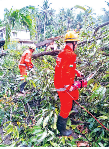
सत्तरी तालुक्यात एका काजू बागायतीला लागलेली आग. वाऱ्यामुळे पडलेली झाडे हटवताना वाळपई अग्निशामक दलाचे जवान.