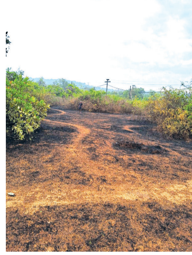
सत्तरी तालुक्यात एका काजू बागायतीला लागलेली आग. वाऱ्यामुळे पडलेली झाडे हटवताना वाळपई अग्निशामक दलाचे जवान.