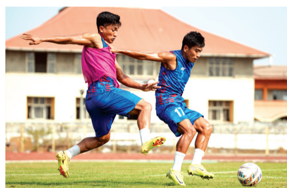
Players of FC Goa fight for the ball during a training session.