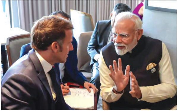
According to an Indian readout, PM Modi thanked President Macron for accepting the invitation to the AI Impact Summit to be hosted by India in February.

In a social media post, the French President said he presented to Modi the